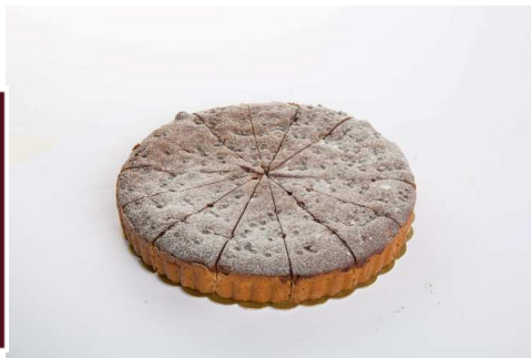
Immagine a scopo illustrativo

Prodotto dolciario congelato. Morbida pasta frolla farcita con crema al cioccolato ricoperta di plum cake. Porzionata in 14 fette.